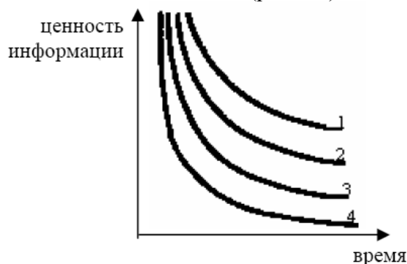
Рис. 7.2. Графики старения информации: 1 – работы по философии; 2 – работы по химии; 3 – работы по физике; 4 – технические работы

Графики для информационного (качественного) изображения функциональной зависимости выполняются без шкал значений величин (рис. 7.2).